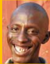
Student Makarere University, Uganda