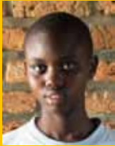
Student University of Rwanda, Ruhengeri

Juni 2013, dit overzicht wordt één keer per jaar geactualiseerd.